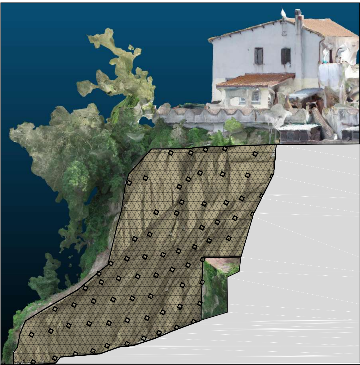
Vista laterale Nord

- Tiranti Barre + rete romboidale Tecco G 65/3 o similari