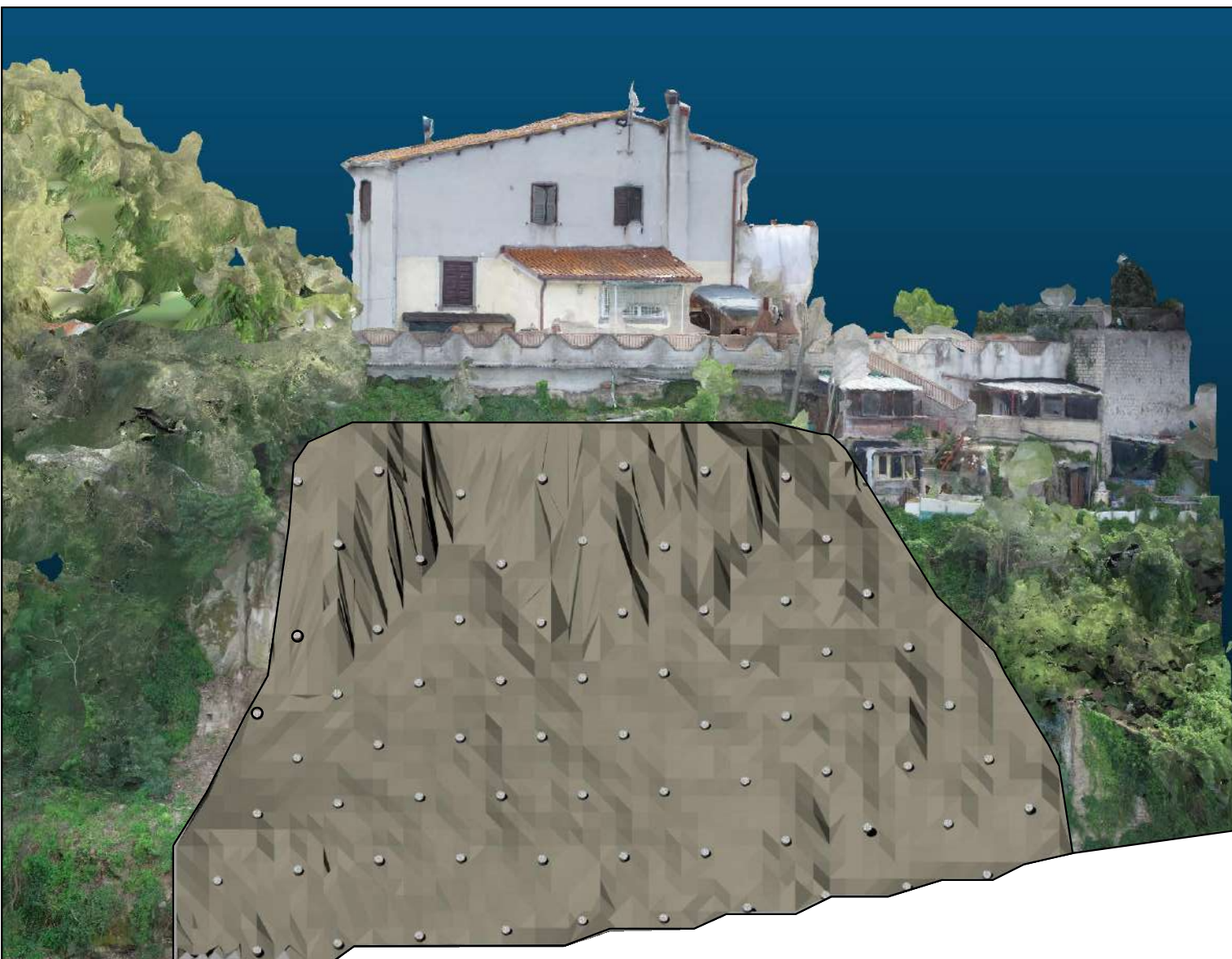
Vista laterale Sud

- Tiranti Barre Ø 32, interasse 3 mt (orizzontali e verticali)