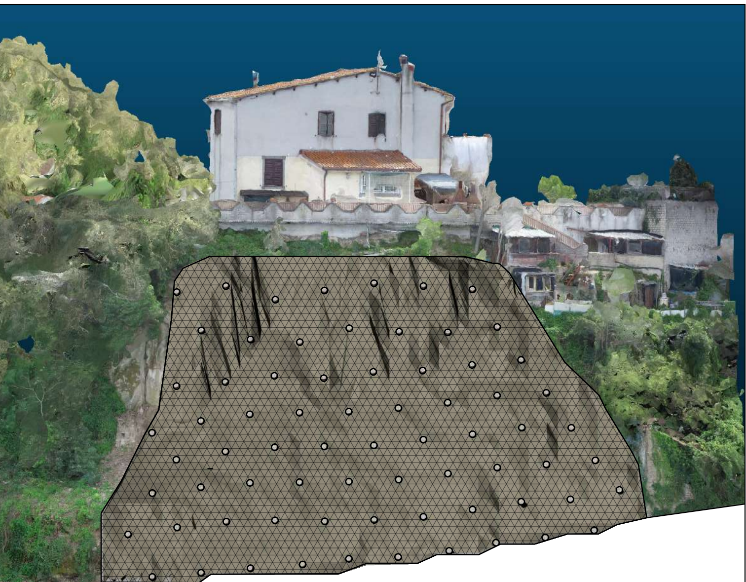
Vista laterale Sud

- Tiranti Barre + rete romboidale Tecco G 65/3 o similari