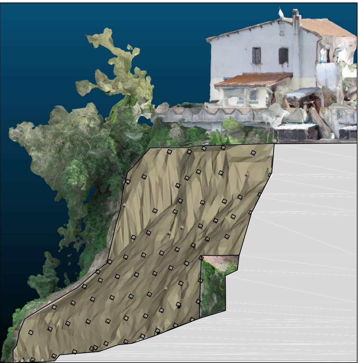
Vista laterale Nord

- Tiranti Barre Ø 32, interasse 3 mt (orizzontali e verticali)