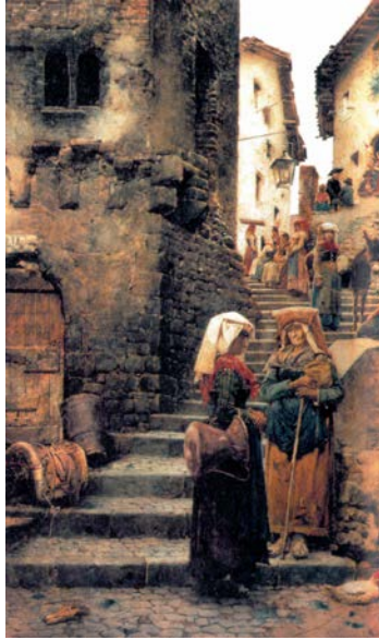
Dipinto ad acquerello su cartoncino: Simoni S. , “Olevano, 1903”, in Mammucari Renato, Ottocento Romano , Roma, Newton Compton, 2007, p. 176 CONS ROMA IA 93

“[...] Vicuittu, vicuittu, ma preché sei cusì strittu? Bubbuiènno la vecchietta, che fa sempre la gazzetta, guarda ardu a chigli titti che se fau sempre più stritti.[...]”