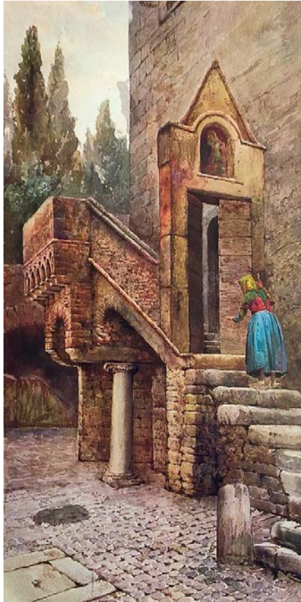
“Casa medievale in via dei Campitelli, presso Villa d’Este”, in Bernoni Carlo e Brizzi Bruno (a cura di), Roma – paesaggi, figure negli acquerelli inediti di Ettore Roesler Franz , Roma Colombo, 1986, p. 132.