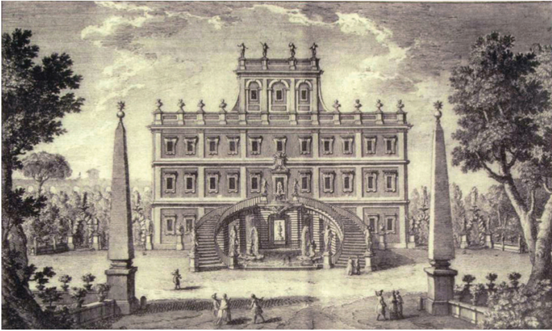
“Casino della Villa Altieri sul Monte Esquilino...” in Vasi Giuseppe, Raccolta delle più belle vedute antiche, e moderne di Roma... , in Roma, 1786, vol. 2°, tav. 96