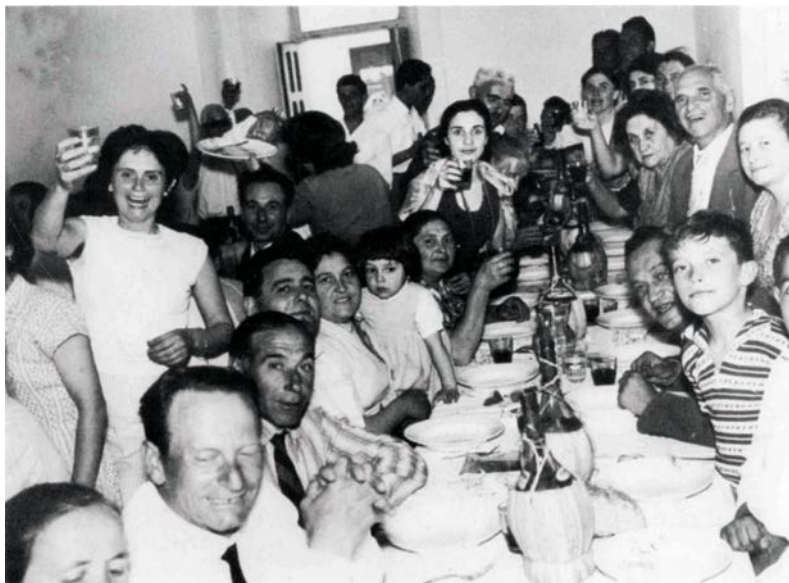
Fotografia b/n: “[Allegra tavolata]”, in Marano si racconta. Persone, luoghi e avvenimenti in oltre 200 scatti dal 1900 al 2000 , Subiaco, Centro Anziani di Marano Equo, [s.d.] CONS Comuni R 970

“[...] La gente che ce abbit’è contenta, nisuno, a me me pare, se lamènta: j’ambiente è bbono e retenutu sanu pe’ l’ospitalità e gli’ aspett’umanu. [...]”