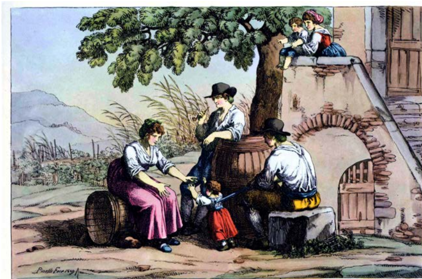
Famiglia di Vignaroli

Incisione all'acquaforte: Pinelli Bartolomeo, "Famiglia di vignaroli" [Campagna Romana],