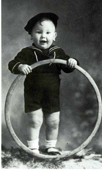
Fotografia b/n: “Tivoli (1941): bambino con cerchio...”, in Immagini (Valle dell’Aniene 1870-1950) , ITCG E Fermi di Tivoli, Roma, Technipress, 1989, p. 142 CONS Comuni CB 123

“[...] Fuji e refuji / Puru se ‘nciampa Èsso ‘nu piantu/ E sse recampa... Ju circhiu meju / Certu se sa Sempre ju pprimu a la cadà...!”