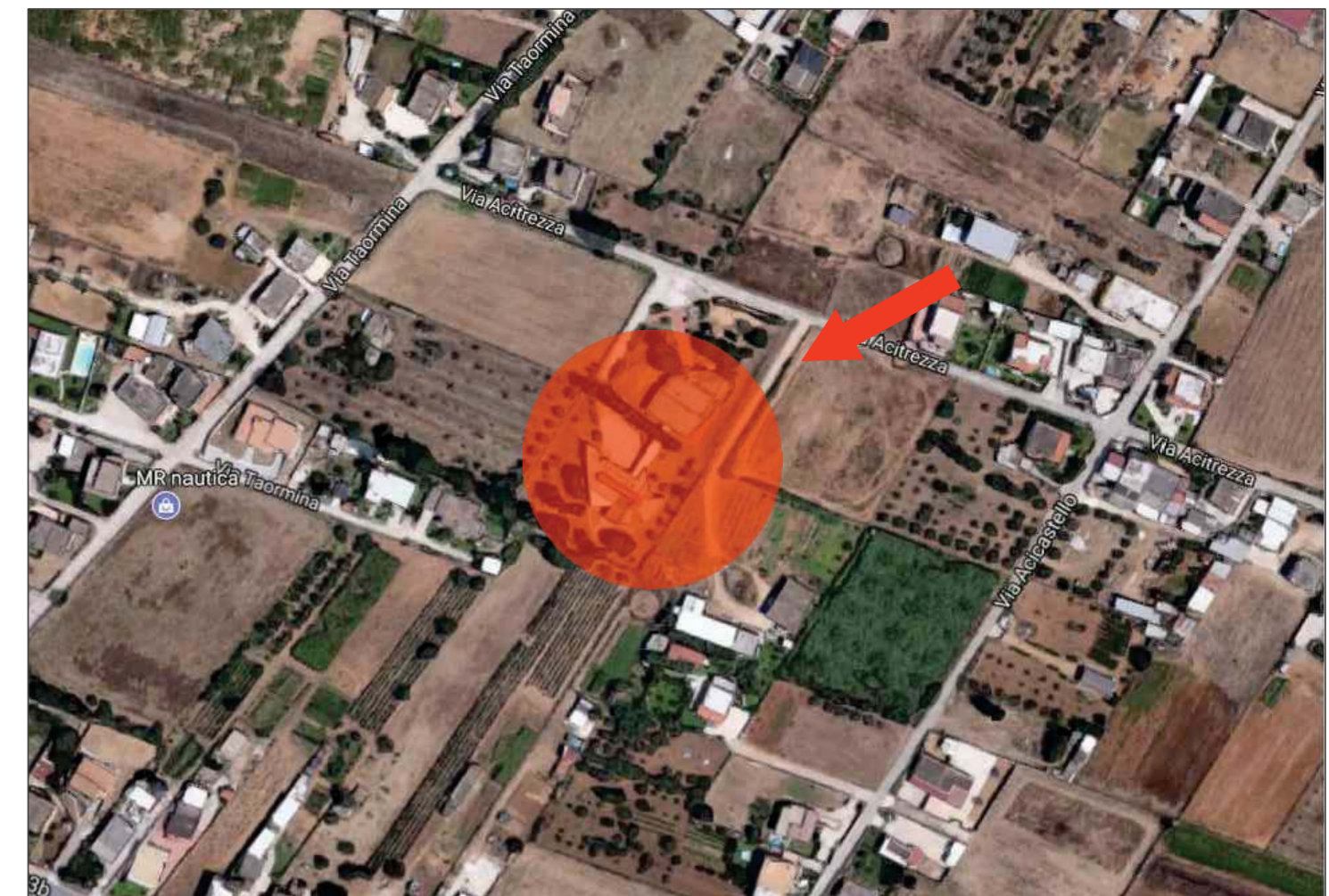
Aerofotogrammetria Fuori Scala