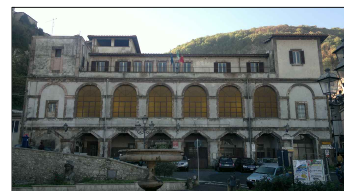
TAVOLA n. 3