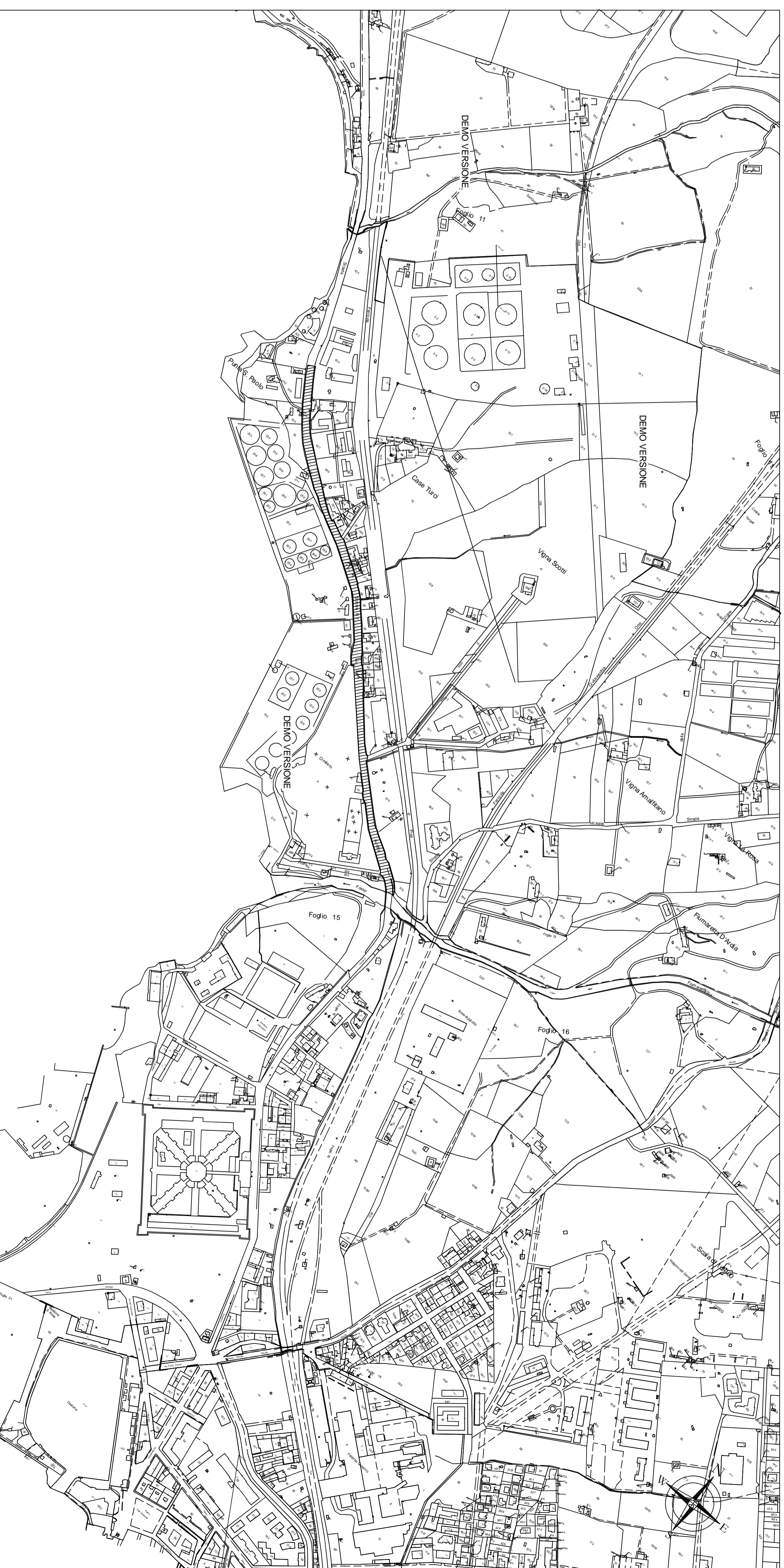
STRALCIO CATASTALE - Scala 1:5000