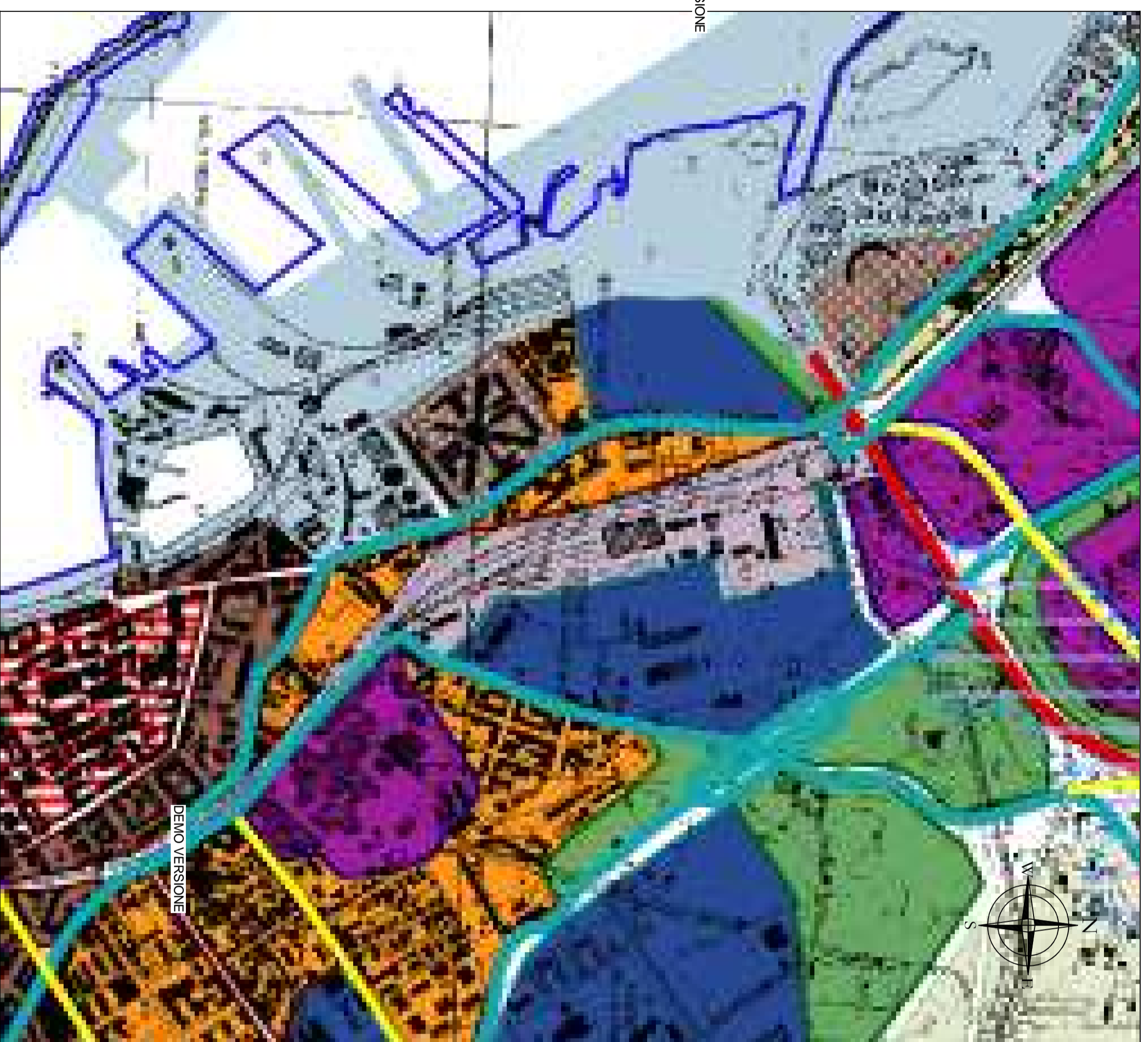
STRALCIO PRG - Scala 1:10000