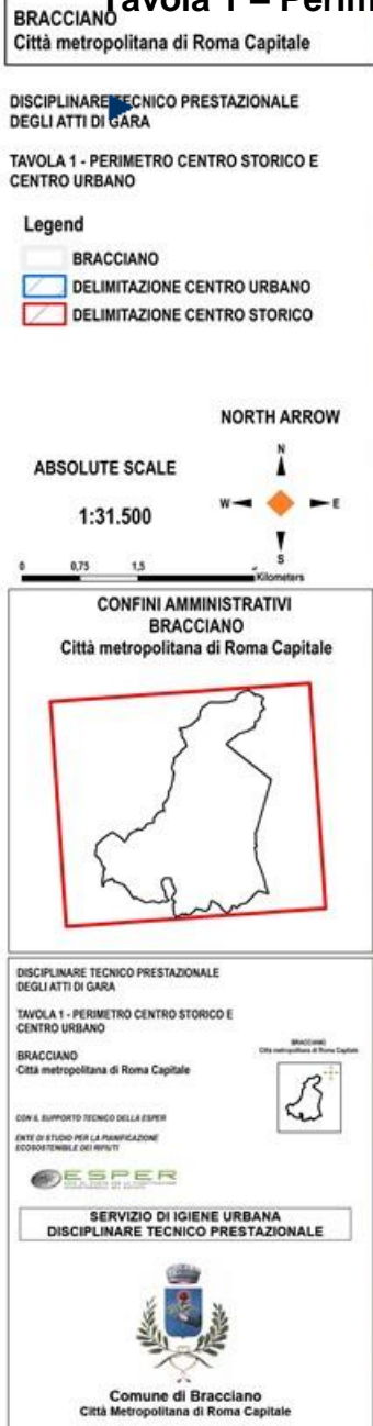
Tavola 1 – Perimetro centro storico e centro urbano