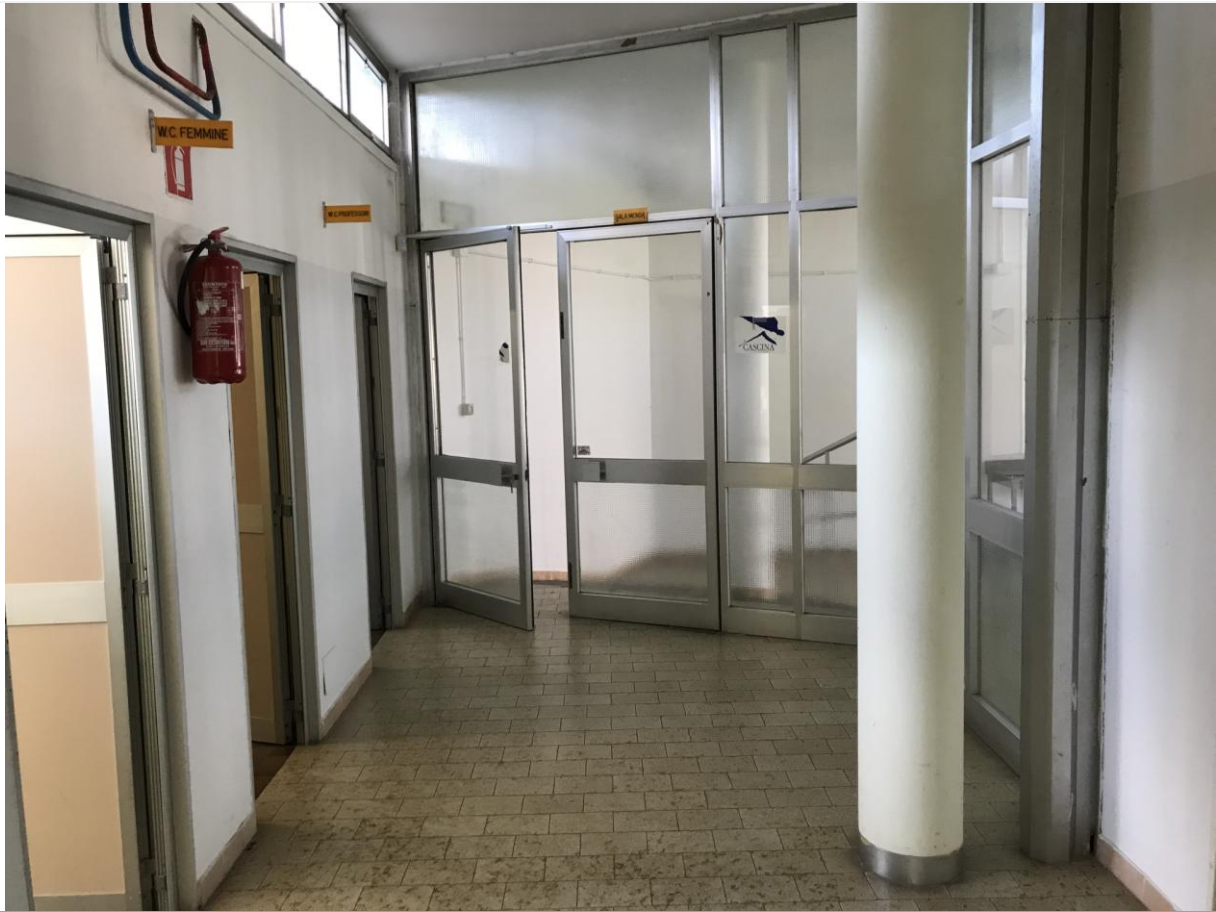
Spazio di separazione tra scuola media e locali in disuso