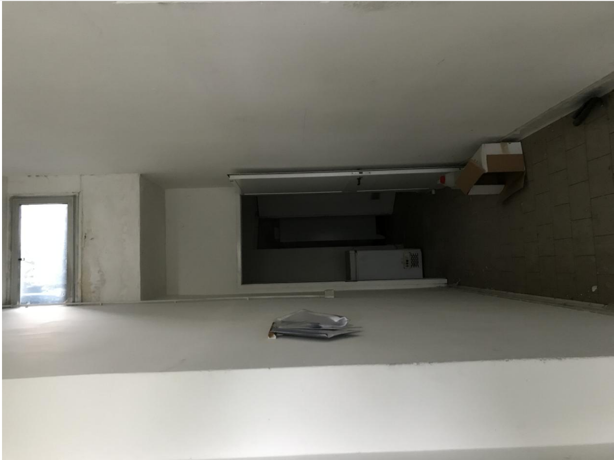
Locali in disuso – Interno