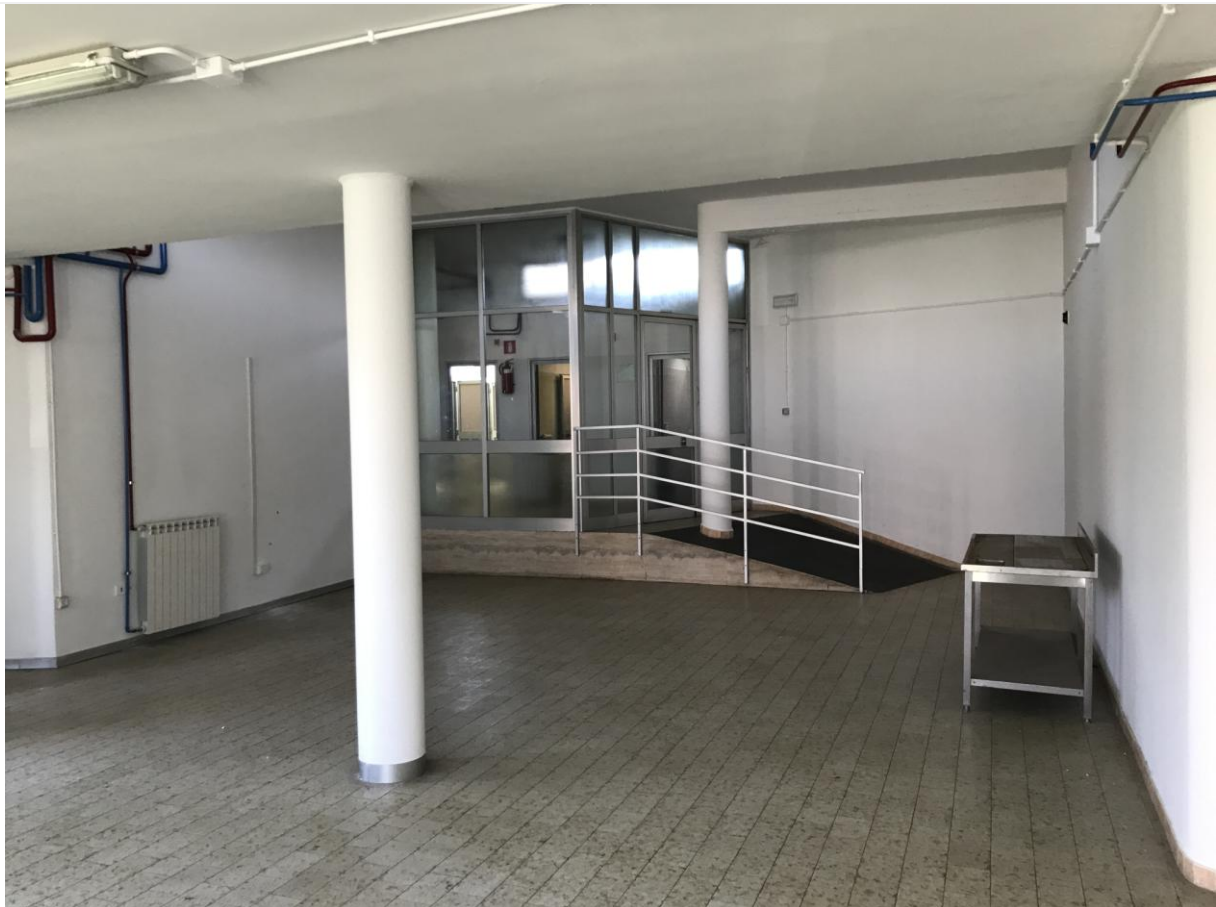
Locali in disuso - Interno