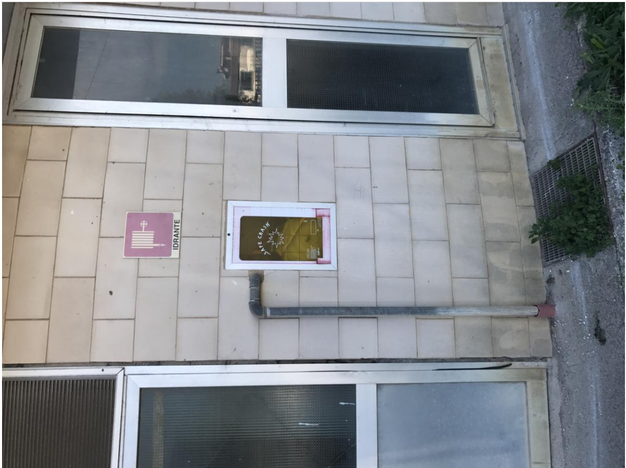
Prospetto Est - Particolari