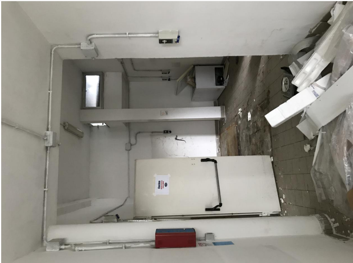
Locali in disuso – Interno