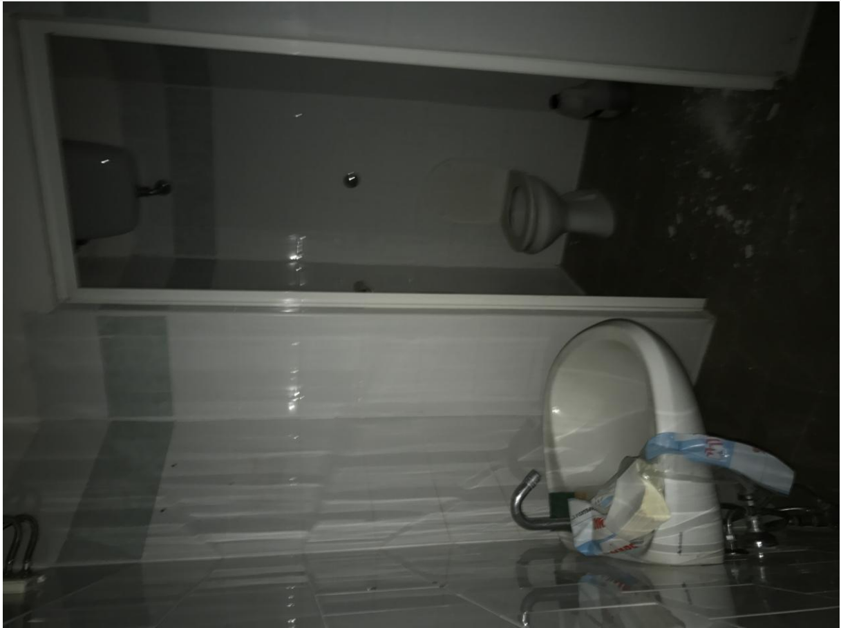
Locali in disuso – Interno – Particolari bagno da smantellare