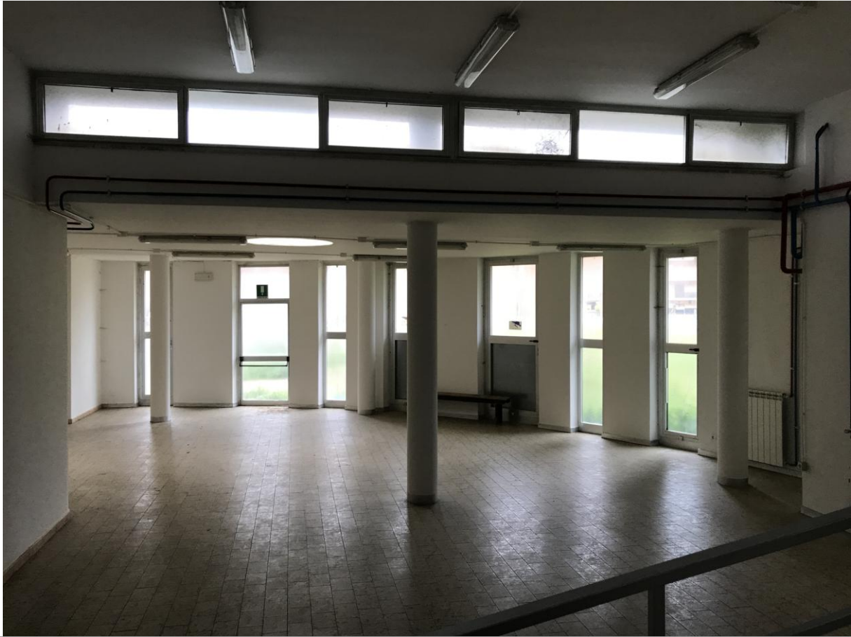
Locali in disuso - Interno