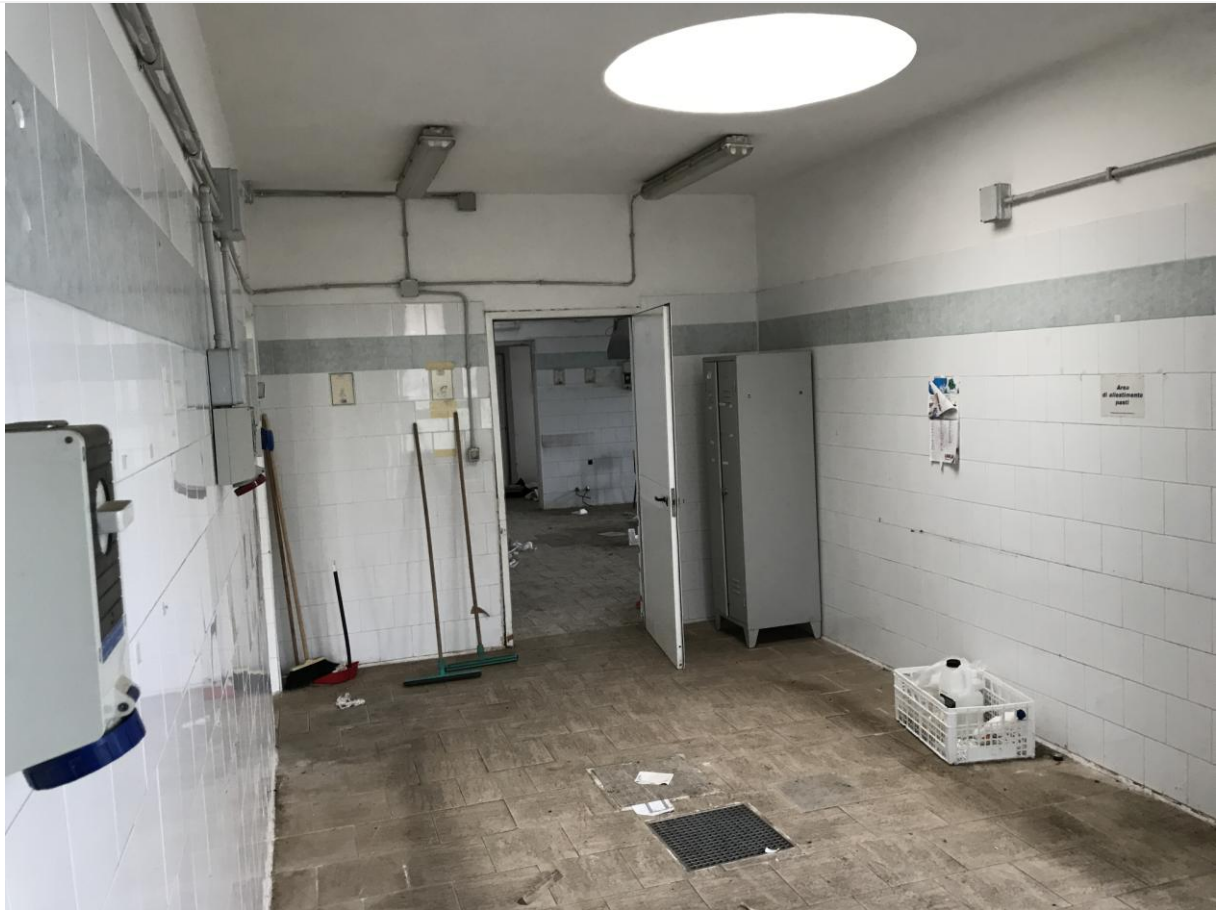
Locali in disuso – Interno – Particolari pavimentazioni e impianto elettrico