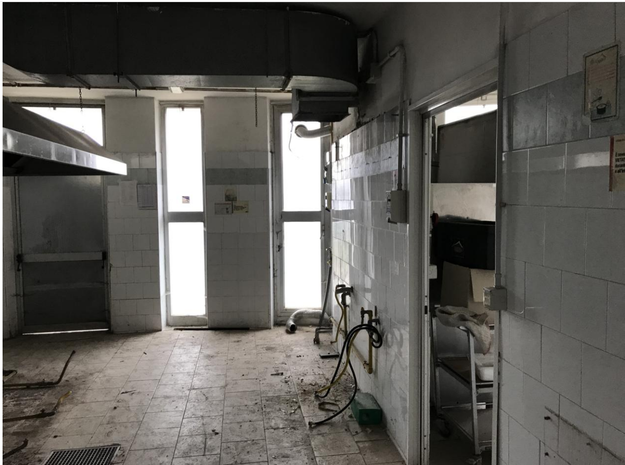
Locali in disuso – Interno – Particolari pavimentazioni e impianto elettrico