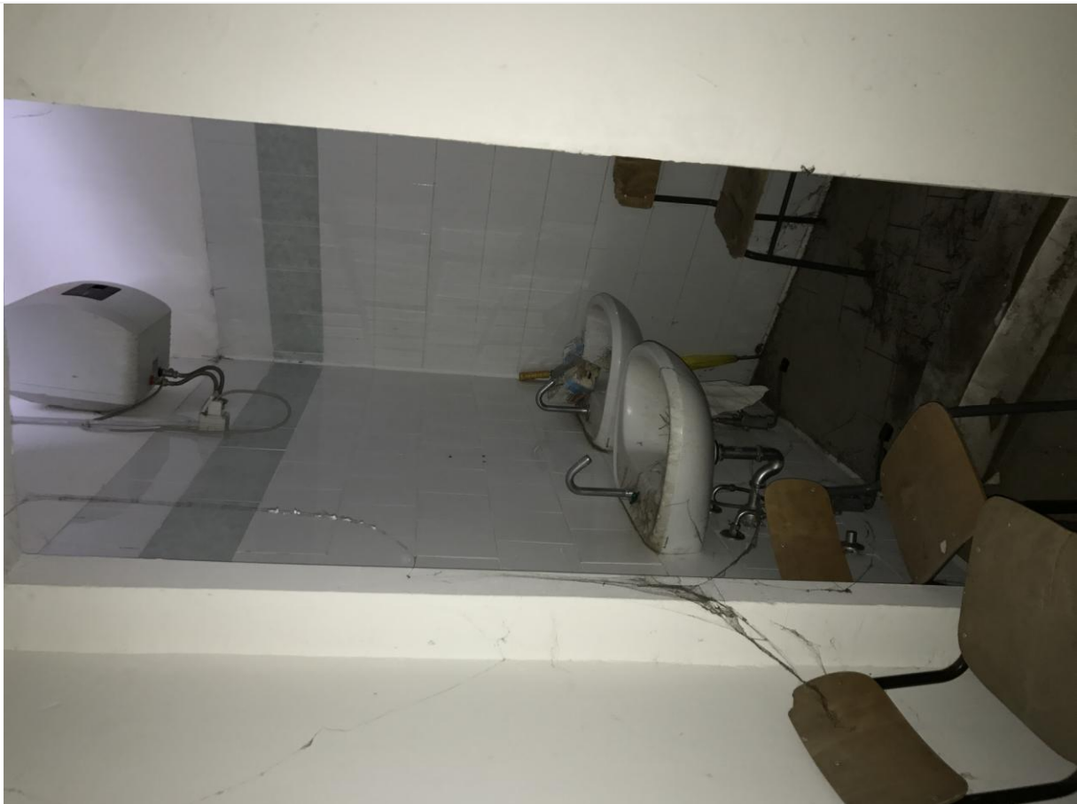
Locali in disuso – Interno – Particolari bagno da smantellare