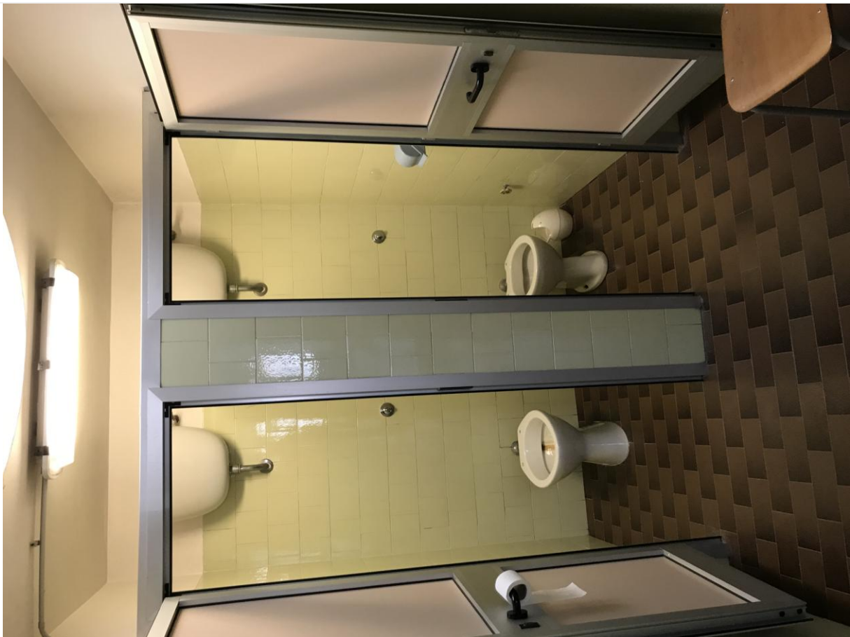
WC - Particolari