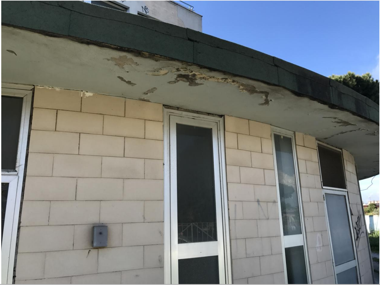
Prospetto Est - Particolari