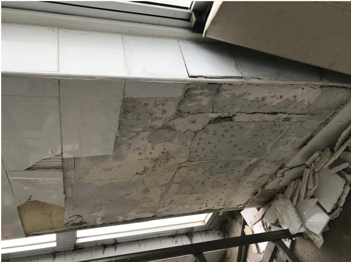
Locali in disuso – Interno – Particolare del rivestimento da rimuovere