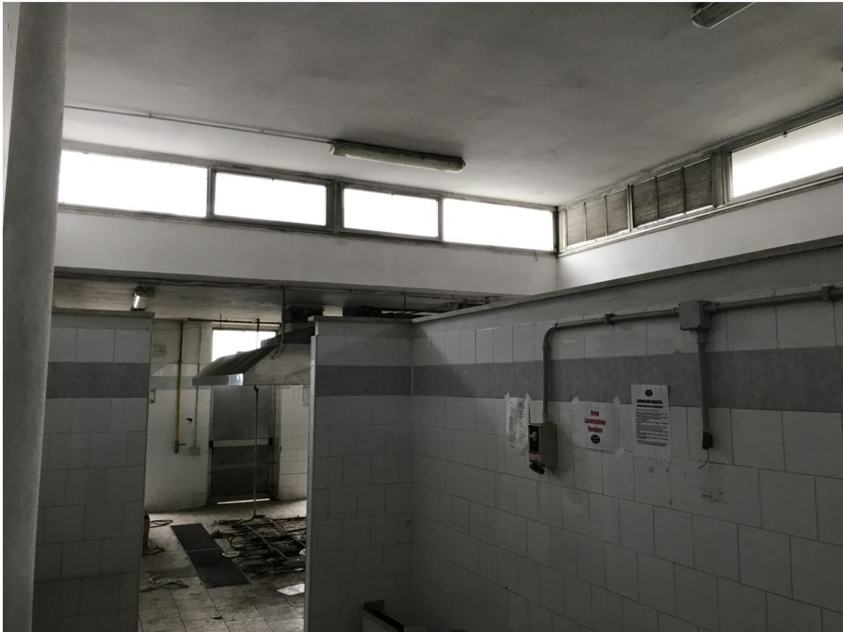
Locali in disuso – Interno – Particolari finestre a nastro