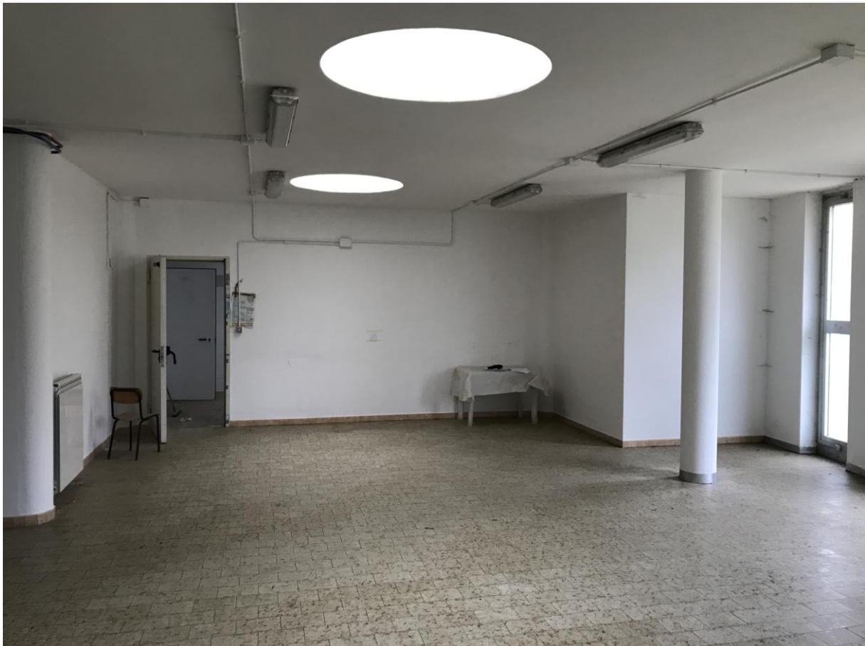
Locali in disuso – Interno – Particolare illuminazione zenitale