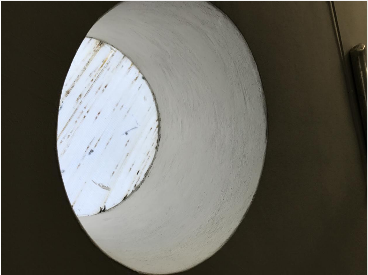
WC – Particolare illuminazione zenitale