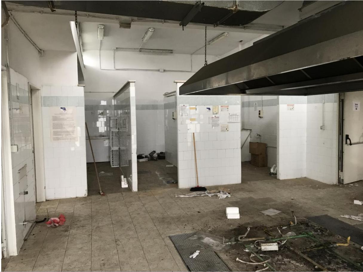
Locali in disuso – Interno – Particolari tramezzature da demolire