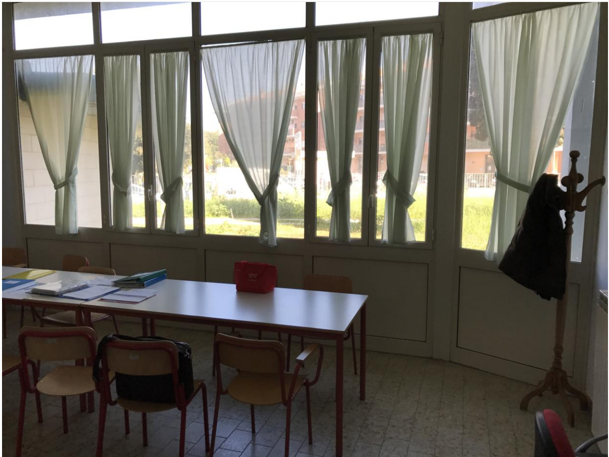
Attuale sala professori