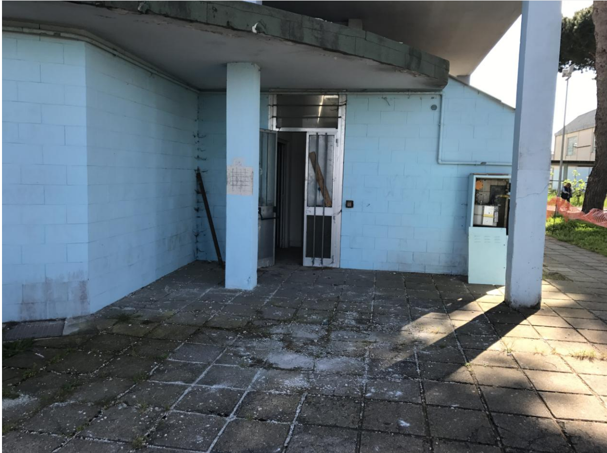
Ingresso locali in disuso