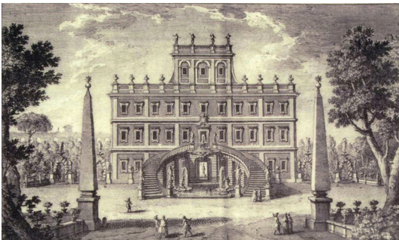
“Casino della Villa Altieri sul Monte Esquilino...” in Vasi Giuseppe, Raccolta delle più belle vedute antiche, e moderne di Roma... , in Roma, 1786, vol. 2°, tav. 96