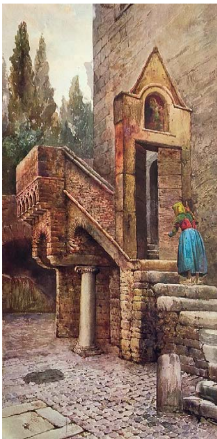
“Casa medievale in via dei Campitelli, presso Villa d’Este”, in Bernoni Carlo e Brizzi Bruno (a cura di), Roma – paesaggi, figure negli acquerelli inediti di Ettore Roesler Franz , Roma Colombo, 1986, p. 132.