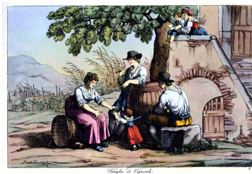
Incisione all'acquaforte: Pinelli Bartolomeo, "Famiglia di vignaroli" [Campagna Romana],

in Bartolomeo Pinelli Torino, R. Aprile, stampa 1965, tav. 5 INC II 24