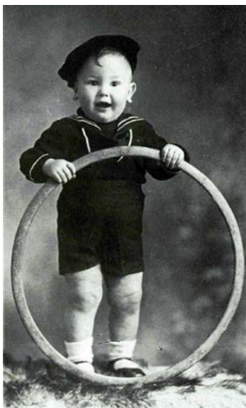
Fotografia b/n: “Tivoli (1941): bambino con cerchio...”, in Immagini (Valle dell’Aniene 1870-1950) , ITCG E Fermi di Tivoli, Roma, Technipress, 1989, p. 142 CONS Comuni CB 123

“[...] Fuji e refuji / Puru se ‘nciampa Èsso ‘nu piantu/ E sse recampa... Ju circhiiu meju / Certu se sa Sempre ju pprimu a la cadà...!”