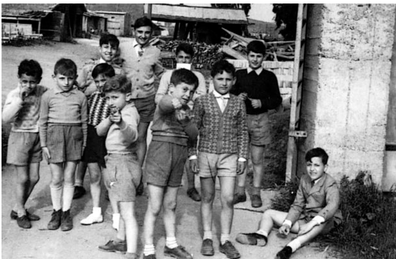
Fotografia in b/n: “I ragazzi dell’Oratorio...”,